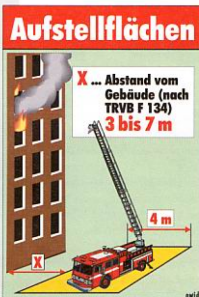
Abstellflächen nach TRVB F 134